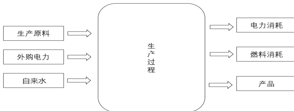
图 1 过程图